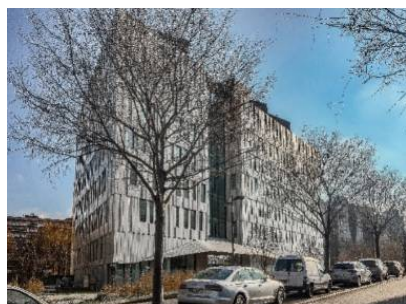
Immeuble Open 6 situé à Lyon Part-Dieu.

Pour le compte du fonds italien UBS-Ziref, UBS Immobilier France réalise sa première acquisition lyonnaise de l'immeuble de bureaux Open 6 de 5 000 m 2 , situé à Lyon au cœur du quartier d'affaires de la Part-Dieu. Acquis auprès d' Arkea Foncière , filiale du Crédit Mutuel Arkea. Open 6 est un immeuble en R+7 totalement loué avec des engagements long terme.